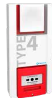
TT4P Type 4 à piles