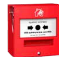
4713R1C Déclencheur manuel étanche avec capot IP65