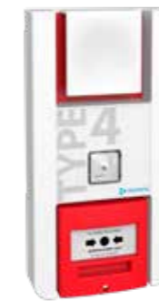
TT4PL Type 4 à piles lumineux