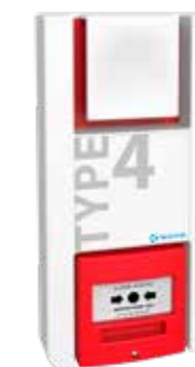
TT4PR Type 4 à piles relais