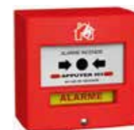
4710R1(C) Déclencheur manuel Disponible avec capot