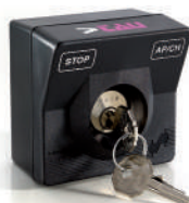
300SCE Sélecteur à clé en applique