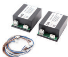
900T-COMM Activateur RS485 pour connecter deux centrales de commande par le système maître/esclave grâce au programmeur de poche TAUPROG. (K126MA-K206MA-D749MA)