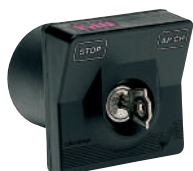
300SC Sélecteur à clé à encastrer