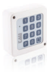
300TSG-4RP Clavier numérique radio à pile, à associer à un récepteur radio 433,92 MHz à auto-apprentissage ou à une centrale de commande avec récepteur radio compatible