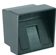
300SCMS1 Sélecteur à clé magnétique