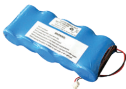
Détail batterie alcalines

*la durée maximale de la batterie est de trois ans, en tenant compte d'un temps de 5 minutes d'alarme pas mois.