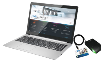
SECARD Kit de programmation SECARD