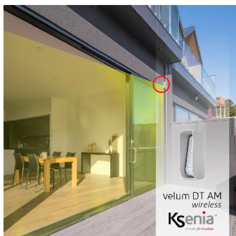
velum DT AM wireless Ksenia

Les détecteurs de mouvement velum wls sont couverts par une garantie de 5 ans (3+2).